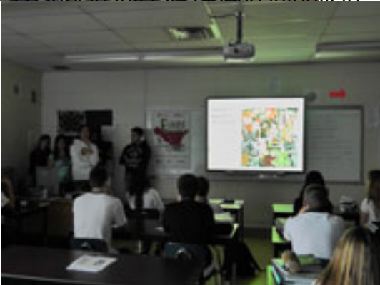
Il gruppo partecipante all'incontro con il Conso