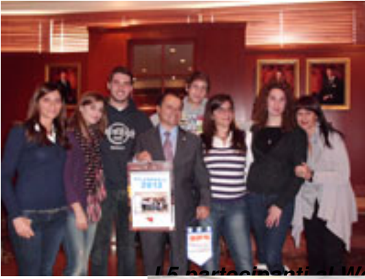
15 partecipanti al Workshop visitano la città di Montreal